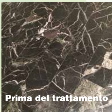
Prima del trattamento