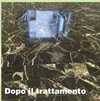
Dopo il trattamento