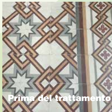
Prima del trattamento