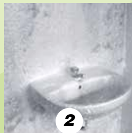
2 AZIONE CHIMICA