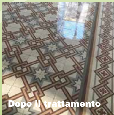
Dopo il trattamento